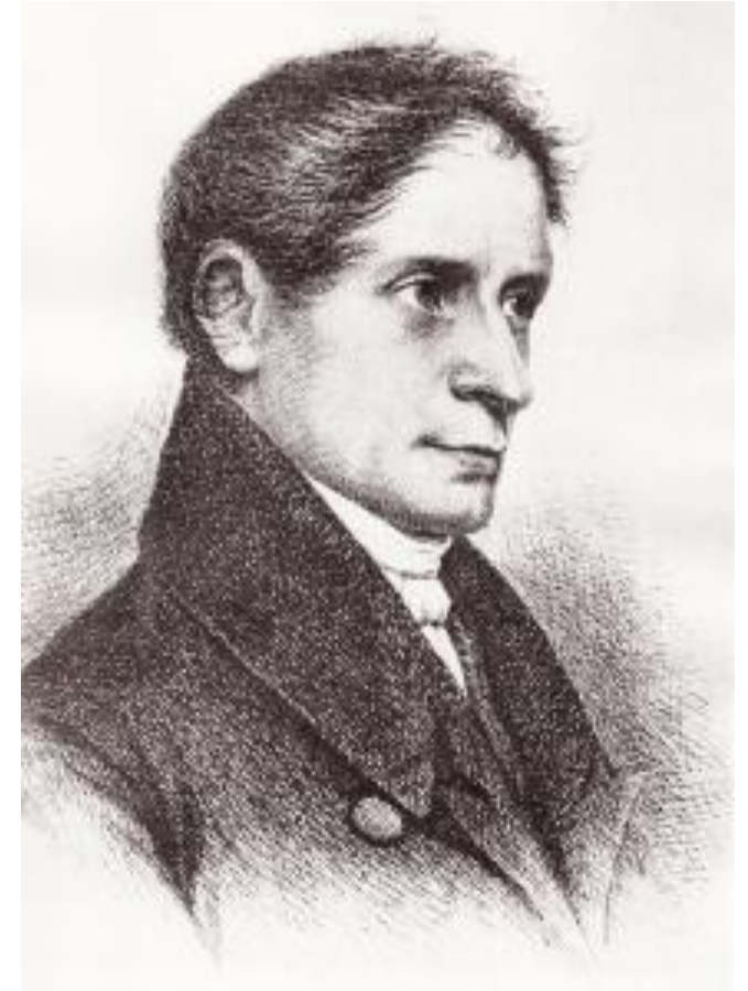
Abb.2: Joseph von Eichendorff