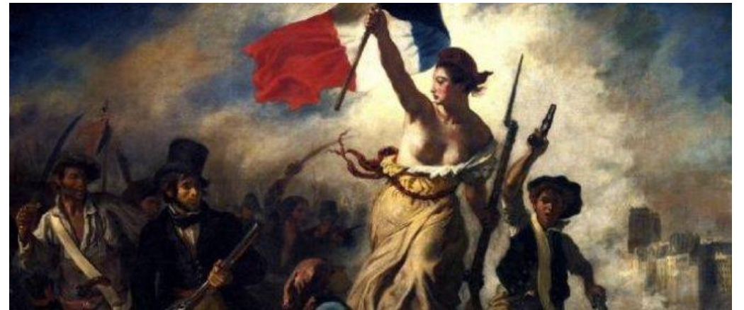
Abb.3: Französische Revolution